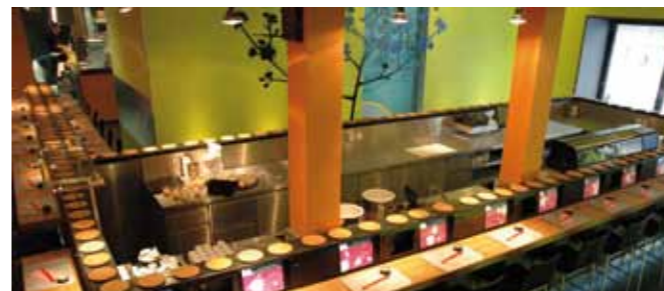
"Yooji's am Bellevue", Zürich (CH)