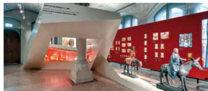
Exposición "Historia Suiza", Museo Nacional Suizo, Zürich (CH)