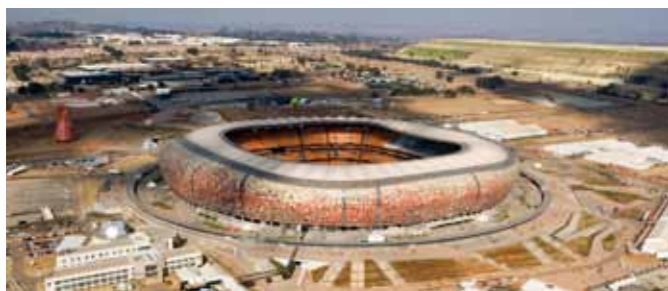
Soccer City, Campeonato mundial de fútbol de la FIFA 2010, Johannesburgo (ZA)