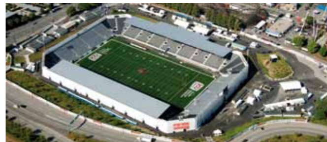
Estadio Empire Field 2010, Vancouver (CA)

La planificación y el montaje de gradas y escenarios es una de nuestras habilidades principales. Gracias a su modularidad y versatilidad, nuestros sistemas de gradas y escenarios pueden utilizarse de diversas formas. Nuestros sistemas de desarrollo propio son el resultado de décadas de experiencia y habilidades resolutivas en construcciones para eventos.