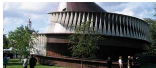
Serpentine Gallery Pavilion 2007, Londres (UK)