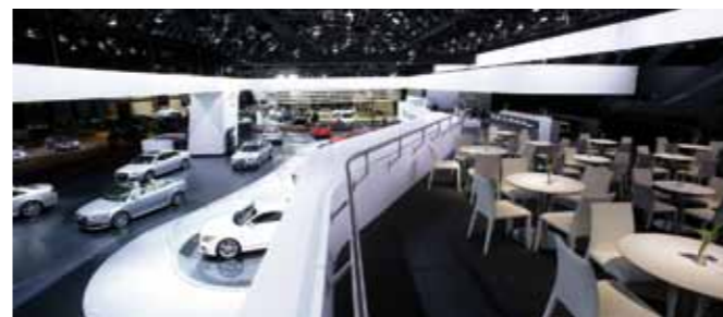
Stand Audi, NAIAS 2009, Detroit (US)