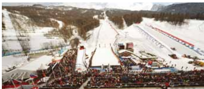
Juegos olímpicos de invierno 2006, Turin (IT)